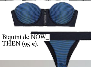
Biquini de NOW THEN (95 €).